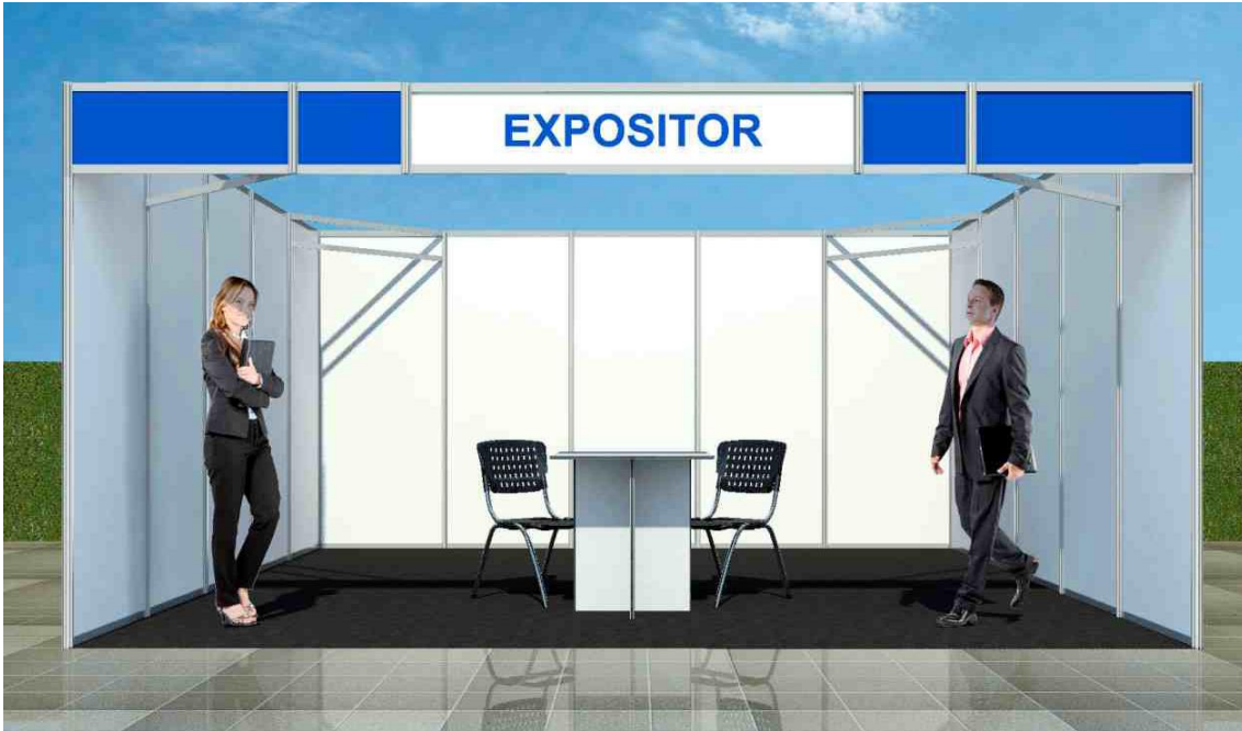
■ Stand Aeronave 20 x 20 400m 2